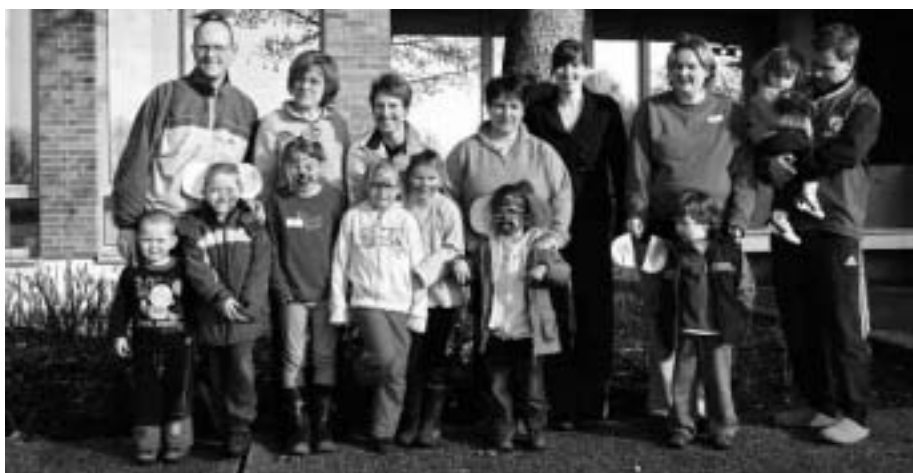
Am Lehrgangs-Wochenende verwandelten sich die Kleinen in Dschungeltiere.