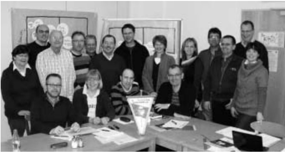
Die Teilnehmer der Klausurtagung der DJK Blau-Weiß Greven

Wo steht die DJK Blau-Weiß Greven im Jahr 2015? Diese Frage beschäftigte an einem Wochenende den Beirat des Vereins, der sich mit dem Vorstand, den Mitar-