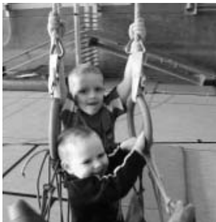
Mit der Raumkapsel geht's auf ins All.

Am Freitagabend stand das bewegte Kennenlernen für Groß und Klein auf dem Programm. Am Samstagmorgen brachte die Krümmelmonstermassage einen lustigen Start in den Tag. Nachdem sich jeder beim reichhaltigen Frühstück stärken konnte, ging es für die Kleinen hoch hinaus. So konnten sie mit viel Spaß verschiedene Erfahrungen auf dem großen