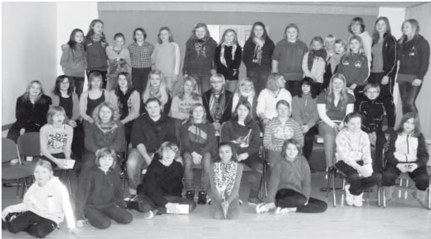
Ein spannendes und abwechslungsreiches Wochenende erlebten die 40 Mädels beim Girls-camp.