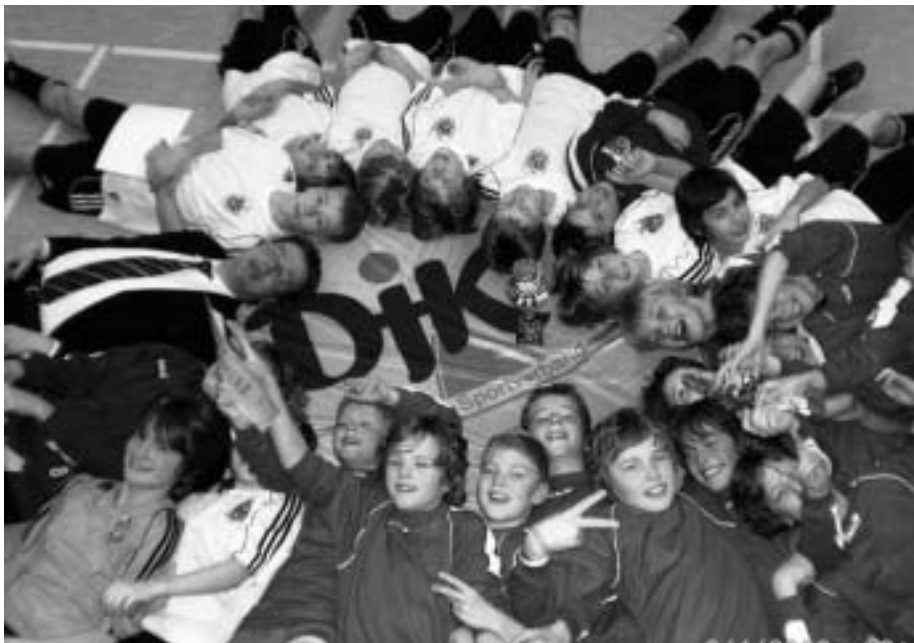
Die D-Juniorenmannschaften des DJK SC Nienberge und der DJK Grün-Weiß Amelsbüren sicherten sich beim DJK-Kreisturnier die Plätze eins und zwei und haben sich damit für das Treffen mit dem niederländischen Verband NKS Ost qualifiziert.

Die Hallenmeisterschaften des DJK-Kreisverbandes Münster fanden dieses Mal beim DJK SC Nienberge statt. Aufgrund der großen Teilnehmerfelder musste die Meisterschaft an zwei Wochenenden ausgetragen werden.