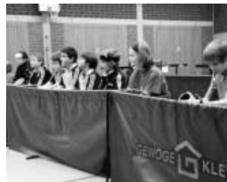
Klein, aber oho: Teilnehmer/innen beim TT-Lehrgang in Kleve.

seiner Vereine her ist der DJK-Kreisverband Niederrhein im Tischtennis zwar klein, aber leistungsmäßig ist und bleibt er oho!