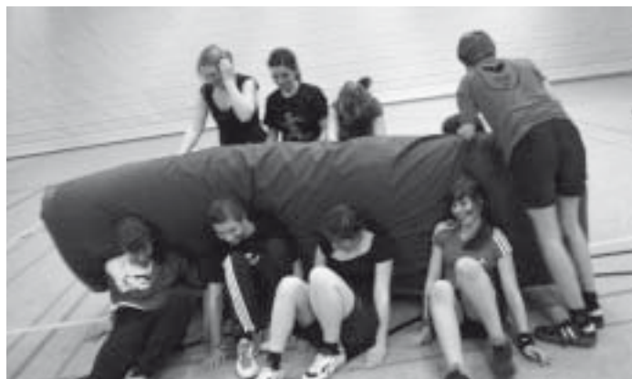
Beim Ringen und Raufen hatten die Teilnehmer sehr viel Spaß.

In der abschließenden Reflexion des Basismoduls waren alle Teilnehmer sichtlich zufrieden. Sie empfanden die Wochenenden als persönliche sowie fachliche Bereicherung und freuen sich bereits auf die anstehenden Aufbaukurse in der Sportschule.