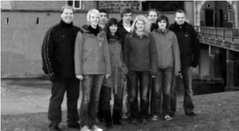
Die DJK-Sportjugend und ihre Helfer stellten auf der Jugendburg Gemen ein spannendes und abwechslungsreiches Programm für das Sport- und Spielfest auf die Beine.

Bereits Ende Februar traf sich die DJK Sportjugend Münster auf der Jugendburg Gemen zur Vorbereitung auf das Spiel- und Sportfest über Pfingsten (21.05. - 24.05.). Im Voraus wurden schon viele kreative Ideen gesammelt und nun konnte