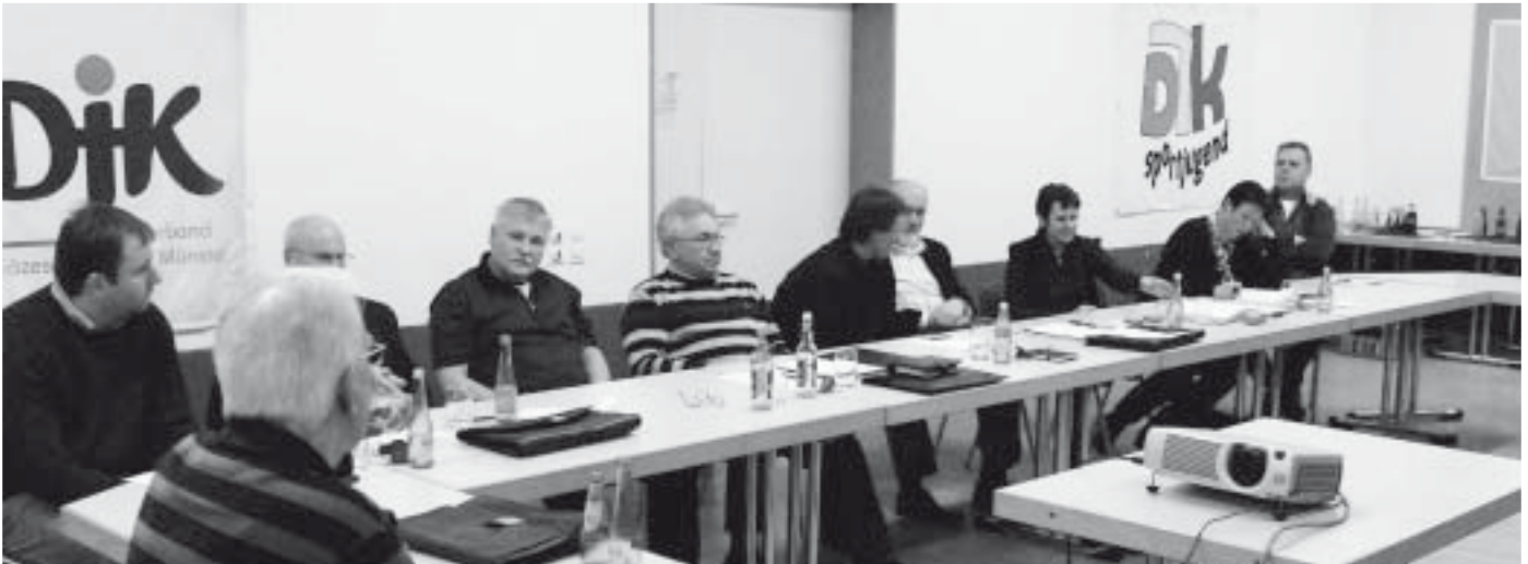
Diözesanvorstand und Kreisvorstände arbeiteten konstruktiv an den zentralen Themen „Kooperation mit der DJK Sportschule“ und „DJK Diözesanverbandstag“.

Diözesanvorstand - und Kreisvorstände tagten in der DJK Sportschule