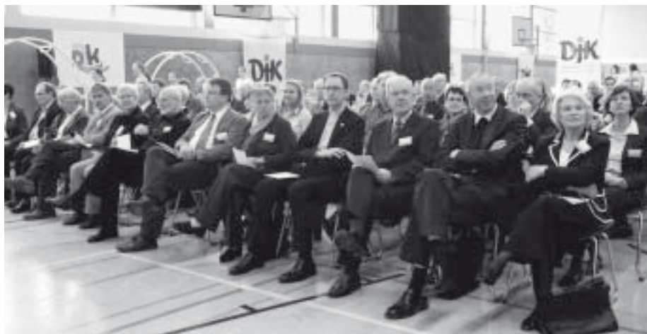
Zum 60-jährigen Jubiläum gratulierten zahlreiche Ehrengäste dem DV Münster.

Dass es sich bei der Jubiläumsfeier um die eines Sportverbandes handelte, wurde nicht erst an der umgestalteten Sporthalle