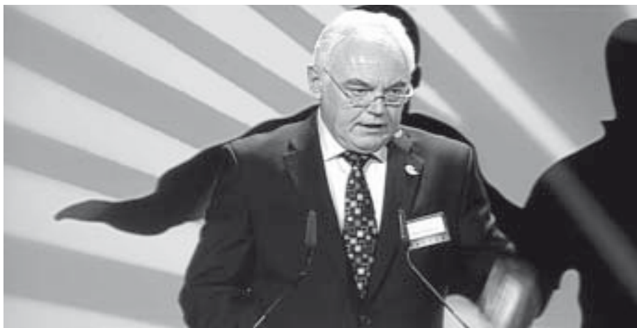
Präsident des LSB Walter Schneeloch bei der Eröffnungsrede.

„Unsere Sportvereine sind erst dann fit für die Zukunft, wenn sie sich in einem stetig verändernden gesellschaftlichen Umfeld den immer wieder neuen Herausforderungen stellen!“ machte der Präsident des LSB, Walter Schneeloch, in seiner Eröffnungsrede zum 1. NRW Sportkongress am 5. und 6. Februar in Bochum den 1.200 Teilnehmern eindringlich deutlich, warum der LSB zu diesem Großereignis eingeladen hatte. Es gelte, die Zukunftschancen der „Organisationsform Verein“ angesichts des schnellen Wandels und gesellschaftlicher Umbrüche zu sichern. Dazu rief er die Teilnehmer des Kongresses auf, in den Themenfeldern „Mitarbeit und Mitgliedererwerb in den Vereinen“, „Strategische Ausrichtung der Vereine“ und „Weiterentwicklung der Verbundsysteme (LSB, Fachverbände, Stadt und Kreis-sportbünde)“ Antworten zu suchen.