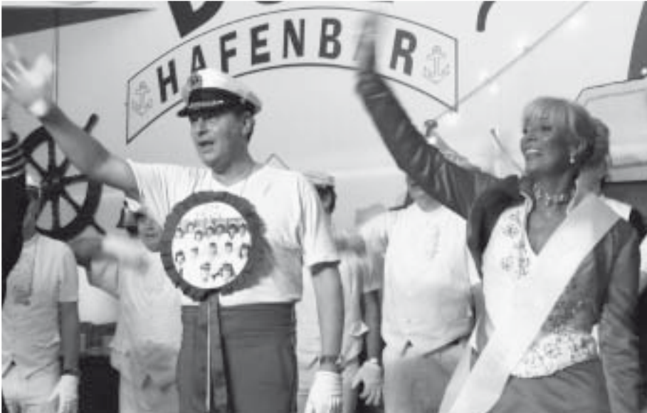
Eine Bombenstimmung herrschte in der Hafenbar der DJK Hüthum-Borghees, wo der traditionelle Frauenkarneval gefeiert wurde.

Zu einem tollen Hafenfest hatte der DJK-Frauen-Elferrat beim 18. Frauenkarneval der DJK Hüthum-Borghees in die „DJK-Hafenbar“ eingeladen und alle kamen: Neben den üblichen Piratinnen und Kapitäninnen mit ihrer kompletten Frauenschaft saßen auch ein Hai aus der Tiefsee, begleitet von einem putzigen Seepferdchen, und Blumenmädchen von fernen Inseln im fantasievoll und mottogerecht kostümierten Publikum – eine Spezialität des DJK-Frauenkarnevals eben. Zu dieser Fete in der DJK-Spelunke hatten Seebären keinen Zutritt, höchstens als geladene Artisten und Musikanten auf der Bühne.