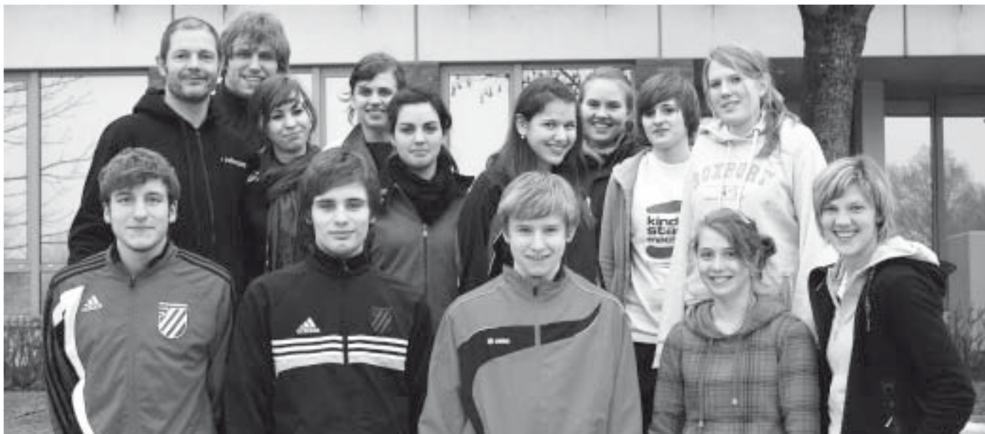
Elf Teilnehmer/innen absolvierten erfolgreich an drei Wochenenden in der DJK Sportschule das Basismodul, das die Grundlage zur Qualifizierung der Übungsleiter-C-Lizenz bildet.

Grundlagen zur Qualifizierung zum/zur Übungsleiter/in C vermittelt