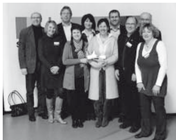
Der DJK-Diözesanverband Münster nahm positive Eindrücke vom Sportkongress in Bochum mit.

Die DJK'ler zogen nach den Abschlussreferaten von Dr. Ingo Wolf und Walter Schneeloch auch für den Diözesanverband Münster ein positives Fazit: der Kongress bot gute Ansätze zur Standortbestimmung und zeigte Wege für die gemeinsame Arbeit an der Zukunftsfähigkeit auf.