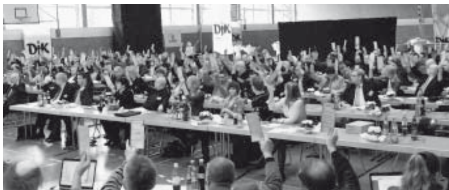
Eindeutige Ergebnisse bei den Abstimmungen im Plenarteil.