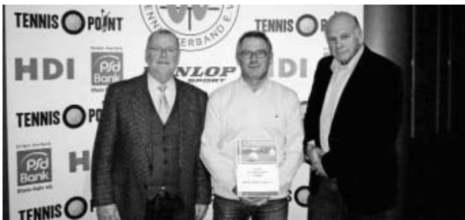
Die Tennisabteilung der DJK Dülmen wurde beim WTV-Wettbewerb „Verein des Jahres“ mit dem zweiten Platz ausgezeichnet.

DJK Dülmen Tennisabteilung auf dem 2. Platz